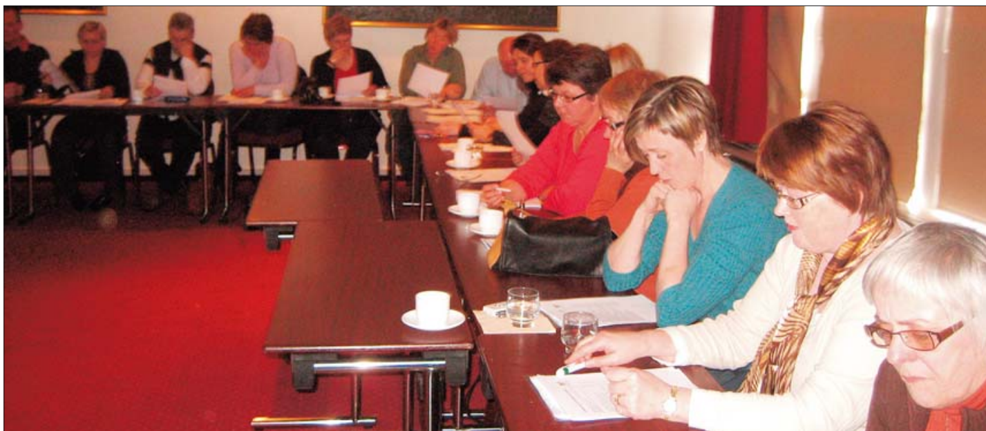
Námsdagur trúnaðarmanna um einelti á vinnustað 4. febrúar 2008.

þarfagreining fyrir starfsþróun hjá Framkvæmdamiðstöð Akureyrarbæjar og til námsstefnu Hjallastefnunnar, Gleði - fagmennska.