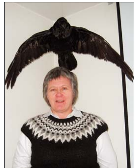
Formaðurinn á hrafnaflogi...?

Kjarasamningar vegna starfsmanna sveitarfélaga, Hjallastefnu, Dalbæjar, Norðurorku hf. og tónlistarkennara voru lausir 1. desember sl. Allir þessir samningar hækkuðu jafnt og hjá ríkinu þ.e. upphafshækkun kr. 20.300 nema Norðurorku hf., þar var upphafshækkunin kr. 21.000 og gildir samningur þeirra til 31. desember 2010. Samningurinn við launanefnd sveitarfélaga gildir til 31. ágúst 2009. Enn eru samningar vegna Hjallastefnu og Dalbæjar lausir þar sem engin formleg framlenging var gerð á kjarasamningum þeirra. Dvalarheimið Dalbær er með sína kjarasamningagerð hjá Samtökum fyrirtækja í heilbrigðisþjónustu. Hjallastefnan tilheyrir núna Félagi sjálfstætt starfandi skóla en í