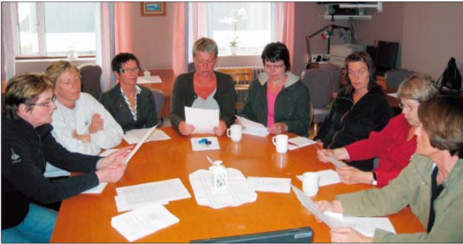
Kynningarfundur á Siglufirði um kjarasamning BSRB og ríkisins í maí 2008.