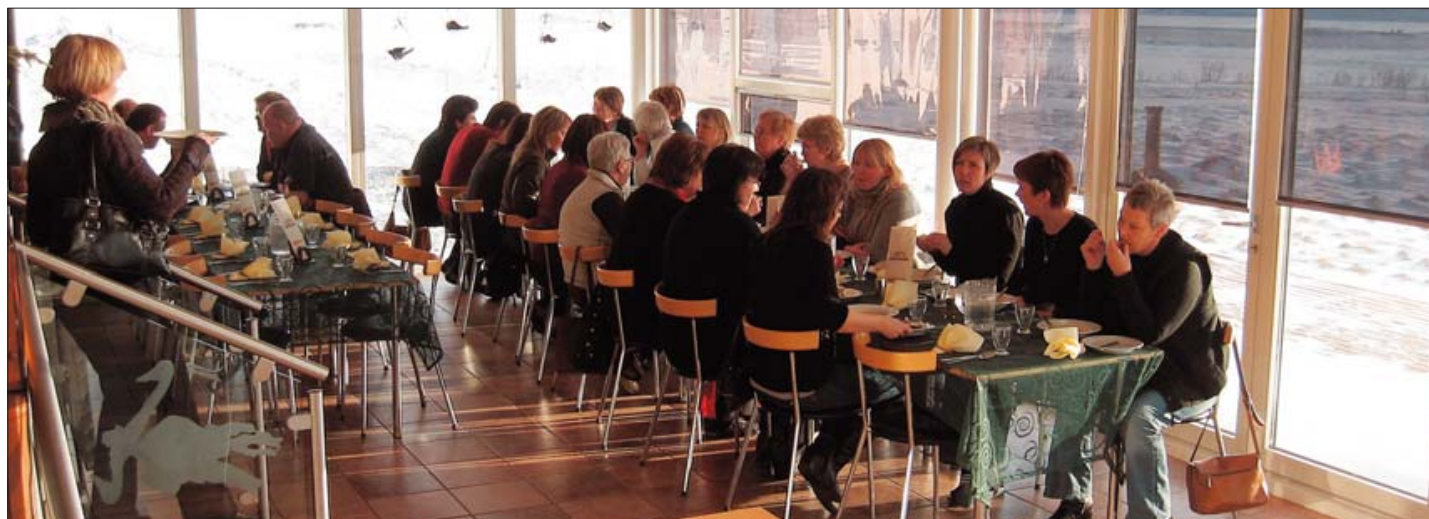
Trúnaðarmenn í hádegismat á fræðsludegi 4. febrúar 2009 að Gauksmýri.