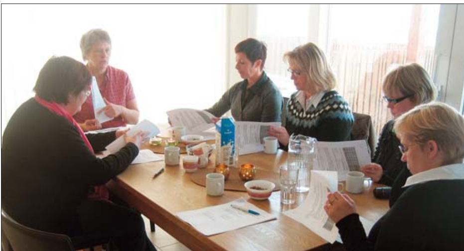
Stjórnarfundur haldinn í sumarhúsinu Vaðlaborgum eftir kaupin á því.