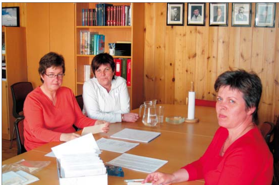
Kjörnefnd að telja atkvæði um kjarasamning við ríkið í maí sl.

Starfsmatskerfið sem notast hefur verið við var hannað í Bretlandi þar sem það var notað til að meta störf í fjölmörgum sveitarfélögum. Kerfið þykir hafa reynst vel í Bretlandi og hefur það verið þýtt og lagað að íslenskum aðstæðum. Sú vinna hefur verið unnin af Launanevnd sveitarfélaga, Reykjavíkurborg og stéttarfélögum. Arna